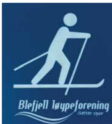
Dette skiltet vil du møte flere steder på fjellet, logoen til Blefjell løypeforening og skiløperen.

Skiltene som viser løypetraseer har fått tre forskjellige farger som angir vanskelighetsgrader. Grønn løype betyr en enkel løype, blå løype betyr medium løype og rød løype er krevende. Noe av poenget her, er at løypeforeningen står ansvarlig for skiløypene og at det skal være trygt å gå i dem.