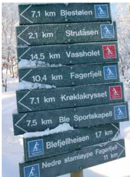
Slik vil du som skiløper møte de nye karttavlene og på dette stedet finnes det både medium og krevende løyper å velge mellom.

– Jeg mener at de nye skiltene er positivt nytt for fjellet. Nå har det blitt lettere å planlegge skiturene, og vi må vel kunne si at fjellet har fått et lite løft med de fine skiltene. Du kan faktisk stå på parkeringsplassen og planlegge skiturene dine og blant annet ta hensyn til dem som skal gå. Ikke alle er i like god form, og da kan det for eksempel være greit å velge en enkel løype, påpeker